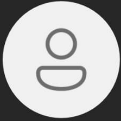
IVAI . 🔇