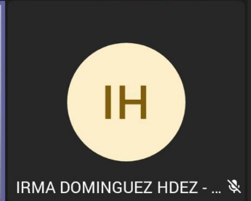
IRMA DOMINGUEZ HDEZ - ... 🔇