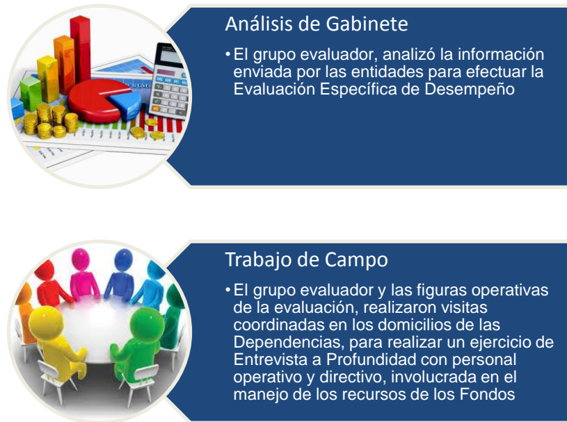
Figura 1. Evaluación de gabinete y de campo

Elaboración propia utilizando gráficos SmartArt.