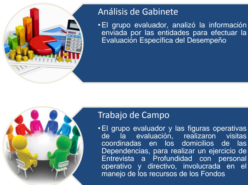
Figura 1, Metodología de la Evaluación