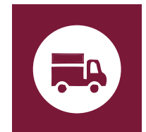
Transportes y almacenamiento