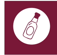
Industria de las bebidas