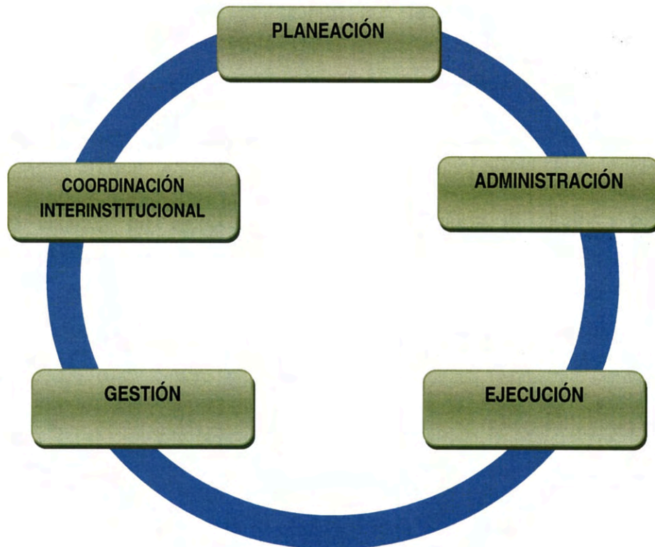
Figura 1. Modelo General de Procesos

actividades que corresponden a su marco de responsabilidad, teniendo como propósitos primordiales evitar la duplicidad de esfuerzos, transparentar y hacer más eficiente el uso de los recursos.