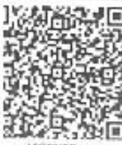
Imagen Original del Complemento de Certificación

El servicio que ampara esta Factura están sujetos a condiciones de uso y de pago. En caso de haber algún problema con la prestación de este servicio, se resolverá en el momento de la prestación del mismo, en el entendido de que el transportista no es responsable por daños materiales o personales que ocasionen en el transporte y/o daños a terceros en el caso de accidentes de tránsito.