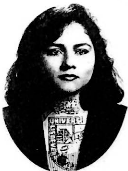
FACULTAD DE ECONOMIA XALAPA, VER.