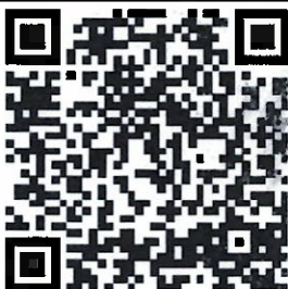
Imagen Original del complemento de certificación digital del SAT [1]1JD37793FF-9674-4615-9751-EBF7E0823595|2020-11-27T16 32:09|gnxFHhgaHCy00A4UITGL5 +102iNv/nX0KY6LiGe7YT2uowYHk4VRYgzE0q+RpHcmLcZAsTwwK16PWEUFVWV4tkeMHd3JGd+zjJOWs+9 HsdDnBV2YvXqGSz66yPnkPCZC5tr+9Zy+I2a+DbgUySdoZJ2Sqd3XeTXJco9MpRXq3O3R4exFqQkaA9+km25 EAyJBaUnuSMDISj9d4cxKpljcd0XB1GF1zMwDc26eXIMheD8Hq2Y2yDDIA6+wnubK1CqAuQw3J1gJnGf6 DqvUpx5uVoDSmzj4EBVkvVVBNA4sdgpXrwhNQYU2TJgYZQAV8LRxhHloPJUksizg==j00001000000406258 094||

Metodo de Pago: PUE Pago en una sola exhibición