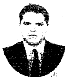
Secretaría de Servicios Académicos

La Secretaría de Servicios Académicos a través de la Dirección de Servicios Escolares de la Universidad Juárez Autónoma de Tabasco, según constancias se encuentran en el archivo de esta institución, certifica que